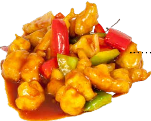
..... 206 MAIALE IN SALSA AGRODOLCE