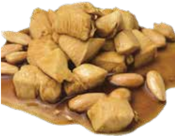
200 POLLO ALLE MANDORLE