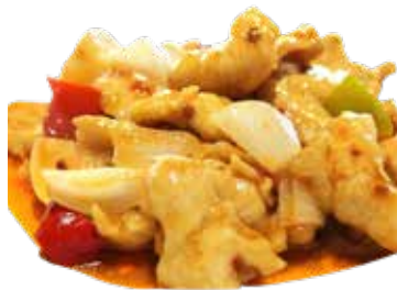
201 POLLO PICCANTE