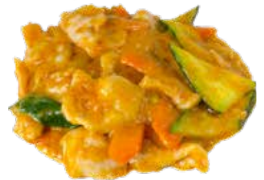
202 POLLO AL CURRY